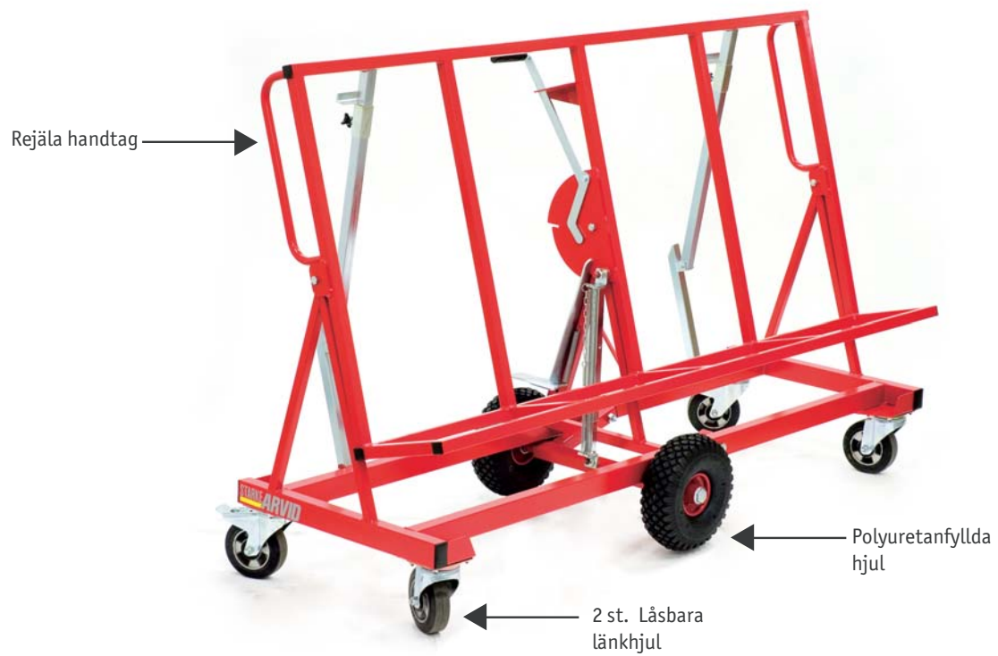
900 mm vagn i uppfällt läge