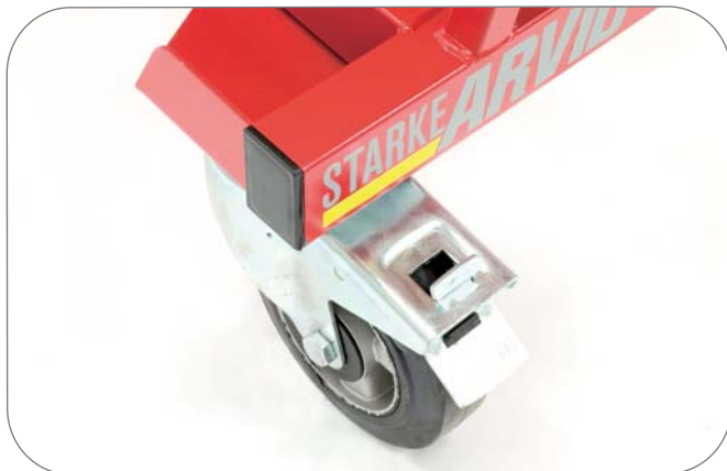
2 st. bromsade länkhjul