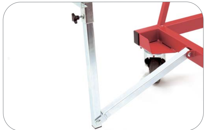
Stödben i nedfällt läge